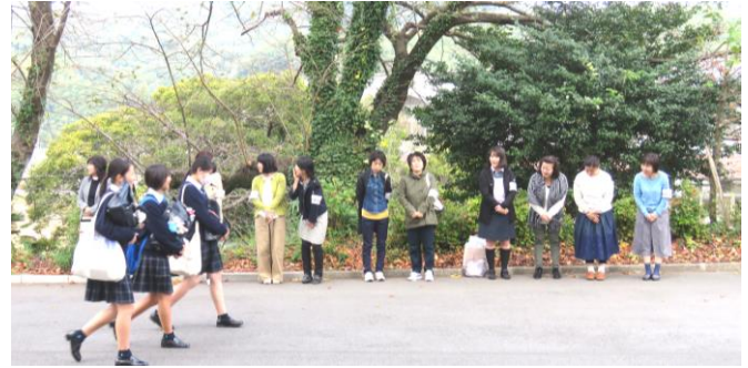
PTA朝の挨拶運動 10月17日撮影