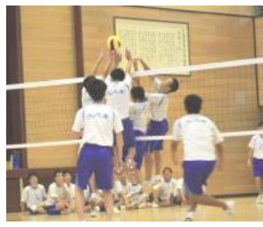
3年生クラスマッチ

「クラスマッチで優勝した！」と、とても喜んで帰ってきました。色々な話を聞かせてもらったのですが、最後の決勝では男子も応援してくれて皆でボールをつないだ…と。娘の表情がキラキラしていて今のクラスの仲の良さが伝わってきて、嬉しくなりました。青春ですネ！ああ羨ましい…！