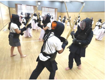
ペルー学校訪問 剣道体験

いつもお世話になっております。「文徳点描」は生徒の様子のみならず、保護者の方の意見も見ることができてとても参考になります。