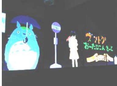
オータムコンサート 美術部のブラックライトアート

先日、私が中学卒業で書いた文集を見つけた。「夢」というタイトルで書かれた作文は高1の娘と変わった年頃の私の希望に溢れたものでしたが、そのなかに「夢は見るものではなく、自ら実現させる為のものだ」と書かれていました。実はその夢は未だに実現せず、まだ「夢」として私の中に生きています。いつか叶えるときあらためて娘にも夢があります。ただ、その夢のプロセスが人任せなどというのであり、期限付きなもので是非自らの力で実現させてもらいたいと切に願っております。