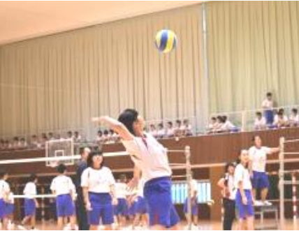
2年生クラスマッチ

いつもお世話になっております。早いものでもう10月。今年もあと3ヶ月となりました。来年の今頃は…と思うとゾクゾクとします。母なのですが…。進路指導部からも載っています。10月は「チャンネルJ」の月だそう。目の前のことに焦点を当て具体的に行動することが次の意欲も高まるそうです。大きな目標に向かって目の前の事を一つ一つ大切に取組んで欲しいと思います。勉強だけではなく、文化祭等の行事も楽しんで欲しいと思います。今後ともご指導の程、宜しくお願い致します。