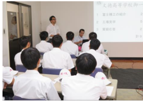
企業見学:富士精工(株)にて

私は、微生物を使って、植物病原菌の生育をコントロールする研究を進めています。自然界に広く分布している微生物「パチルス・チューリンゲンシス(通称:BT 菌)」は、顕微鏡で観察できるほどの大きなタンパク質のかたまりをつくります。一部の BT 菌は、この中に昆虫を殺す毒素をつくるものがあります。BT 菌は農作物に害を及ぼす昆虫に対する安全性の高い“微生物農薬”として実用化されています。微生物の力を利用して、安全安心な“農薬”ができるということです。また BT 菌は、さまざまな生理活性タンパク質もつくっていることがわかってきました。例えば、ヒトの培養ガン細胞に損傷作用を示すもの(パラスポリン)や抗生物質として作用するものなどです。パラスポリンは、ある培養ガン細胞には強力に損傷活性を示すが、ある細胞には全く作用しないなど、選択性を示すことが明らかになっています。このように医療分野での活用も期待され始めた BT 菌。まだまだ微生物の可能性は無限大です。これからも研究を通して、農業や医療に貢献していきます。